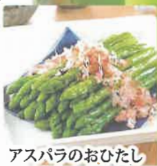
アスパラのおひたし