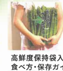
高鮮度保持袋入り 食べ方・保存ガイド付